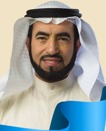
د. طارق السويدان